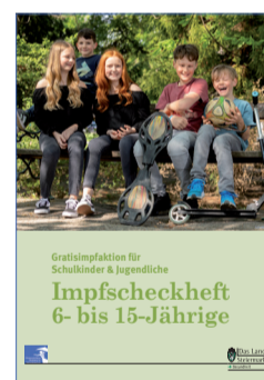
Паспорт вакцинації для дітей віком від 6 до 15 років