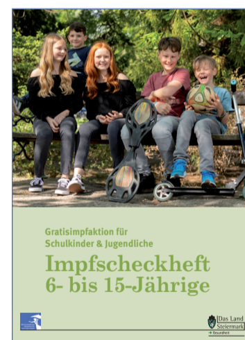
Impfscheckheft für 6–15-Jährige

Sonst genügt 1 Impfung. Für die Influenza-Impfung brauchen Sie keinen Gutschein aus dem Impfscheckheft.