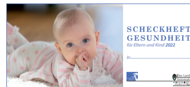
Паспорт вакцинації для дітей від 0 до 6 років

ВАКЦИНАЦІЯ КОРИСНА, БО ЗАХИЩАЄ! БУДЬ ЛАСКА, СКОРИСТАЙТЕСЯ БЕЗКОШТОВНИМИ ПРОПОЗИЦІЯМИ ВАКЦИНАЦІЇ ДЛЯ ВАШОЇ ДИТИНИ ТА БЕЗКОШТОВНОЮ ПРОПОЗИЦІЄЮ MMR ДЛЯ СЕБЕ!