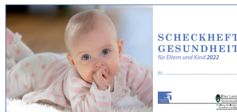
Impfscheckheft für 0–6-Jährige

Im 1. Lebensjahr 2 Schluckimpfungen im Mindestabstand von 4 Wochen Beginn ab vollendeter 6. Lebenswoche; Abschluss spätestens 24. Lebenswoche Diese Impfung ist nur für Kinder im 1. Lebensjahr wichtig, ältere Kinder brauchen diese Impfung nicht.